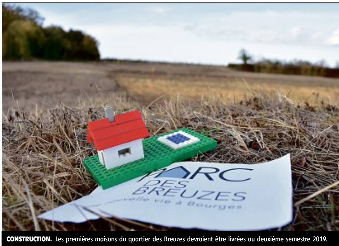
CONSTRUCTION. Les premières maisons du quartier des Breuzes devraient être livrées au deuxième semestre 2019.

Le projet d'urbanisme du site des Breuzes a été lancé en 2009 ( lire par ailleurs ). Il devrait permettre de faire éclore sur cet espace de 40 hectares, entre 550 et 700 logements d'ici 2029. « La